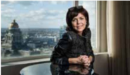
Joëlle Milquet, Présidente du Comité Stratégique et Consultatif d'ECES

le Développement (PNUD) et International IDEA, elle figure aujourd'hui parmi les trois principaux partenaires de l'UE pour la mise en œuvre de l'assistance électorale de l'UE.