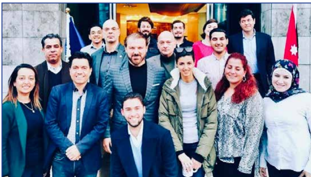
L'Équipe ECES devant le bureau ECES en Jordanie (projet EU-JDID)

Ces lignes directrices couvrent tout, de la compréhension du public à l'analyse des médias sociaux, en passant par la prise de meilleures photos, la rédaction de meilleurs mots, la conception de bannières et de logos ainsi que les droits d'auteur et l'optimisation des moteurs de recherche.