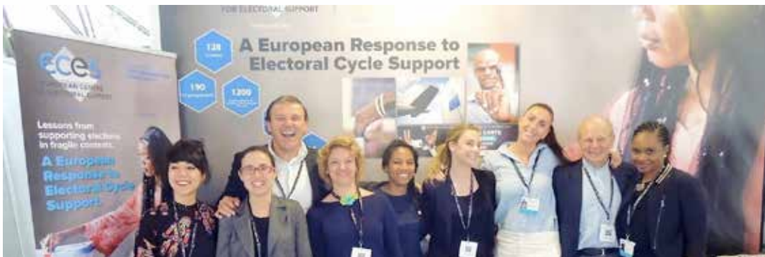
L'Équipe d'ECES aux Journées Européennes du Développement (JED) 2016, Bruxelles, Belgique