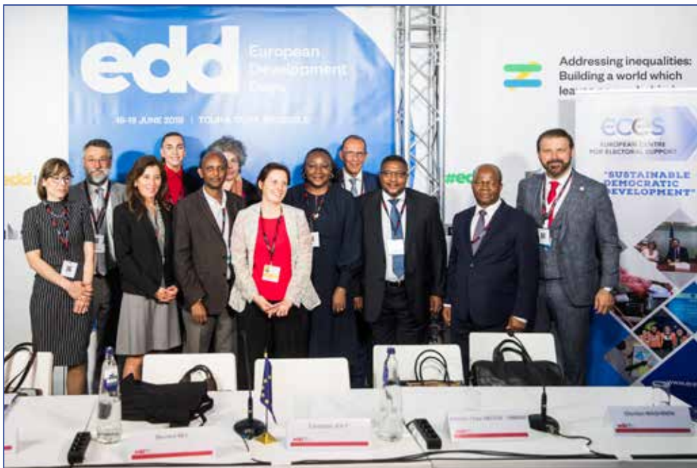
2019, ECES aux Journées Européennes du Développement (JED)

L'obtention de ces deux certifications vise à consolider la structure organisationnelle d'ECES sur la base d'une amélioration continue, ainsi qu'à garantir et à démontrer qu'ECES et ses activités sont conformes aux normes externes et internationales les plus complètes.