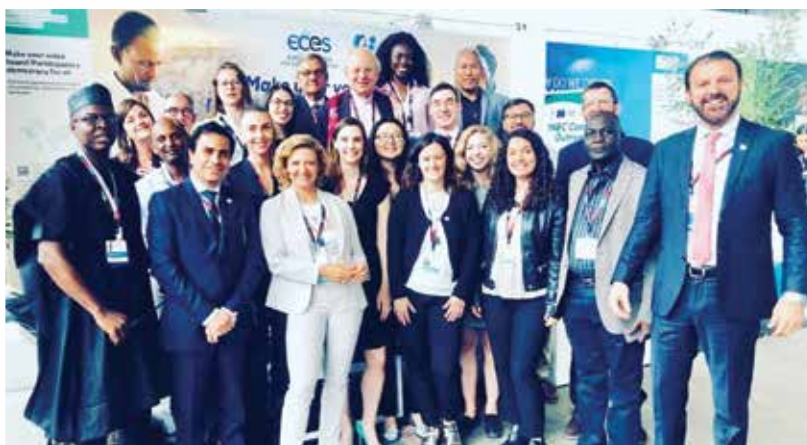
L'Équipe ECES lors des Journées Européennes pour le Développement (JED) en 2019, Bruxelles, Belgique

ECES présente une expérience et une expertise considérable dans le domaine des projets de soutien électorale dans presque toutes les régions du monde. Au cours de ses dix années d'activité, ECES a fourni des services de soutien électorale et de soutien à la démocratie, a mis en œuvre des activités dans plus de 50 pays, principalement, mais pas exclusivement, en Afrique et au Moyen-Orient. En outre, les fondateurs et le personnel d'ECES a acquis une vaste expérience de terrain et, dans l'ensemble, ECES peut compter sur un réservoir de connaissances spécialisées provenant de son réseau bien établi dans le monde entier, dans plus d'une centaine de pays.